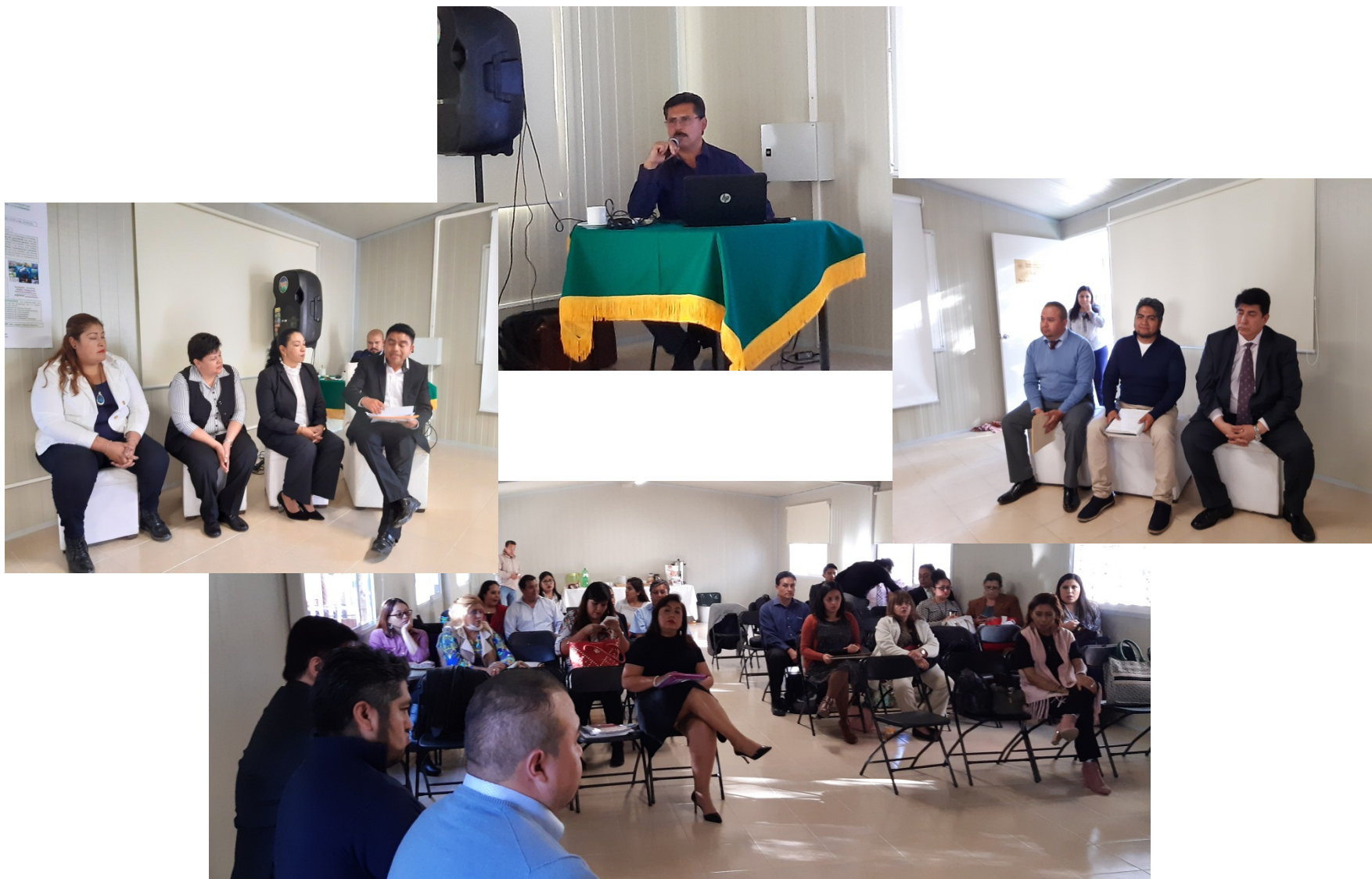
1º. Foro: “La conformación del modelo educativo escolar a partir de la práctica de la enseñanza”